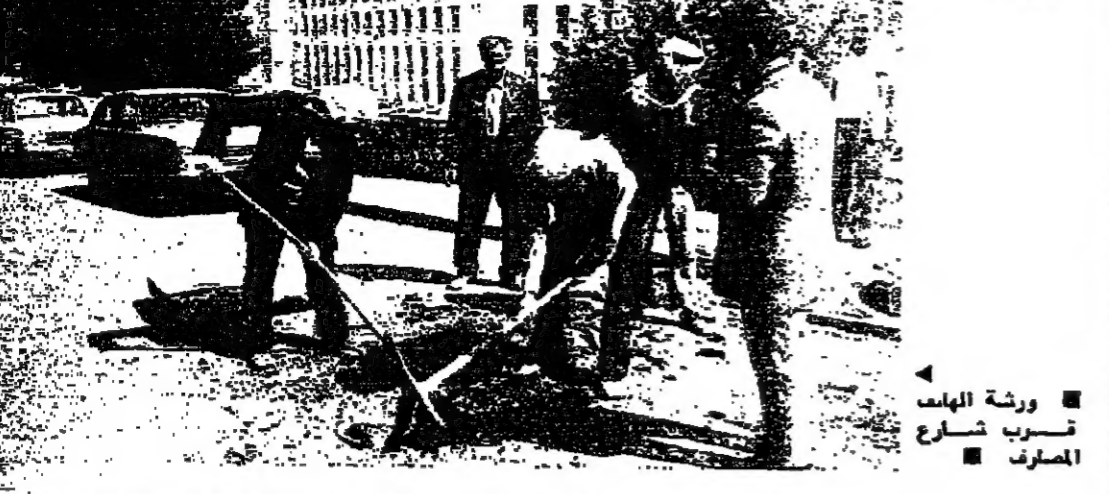
ورشة الهاتم تسرب شارع الصراف